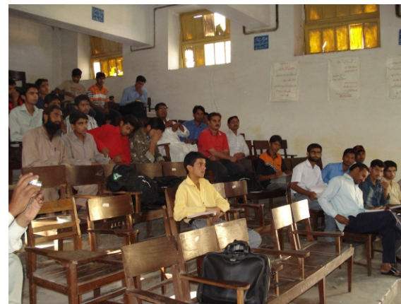
Coaches, Referees and Administrators attending a lecture on "Sports Injuries" at Government Jinnah Islamia College, Sialkot.