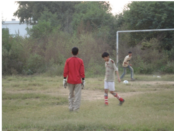
Children Training in a Session at Shaheen Football Ground, Regiment Bazar, Sialkot-Cantt.