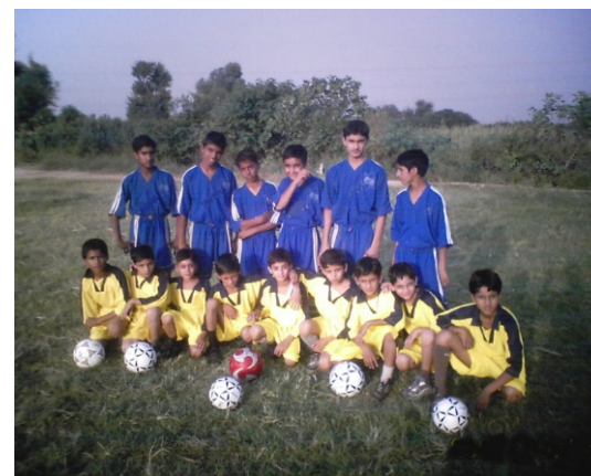
Children Training in a Session at Butter Football Ground, Butter, Sialkot.