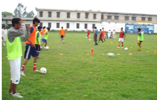
Coaches Training Session in Crescent Football Ground, Sialkot-Cantt.