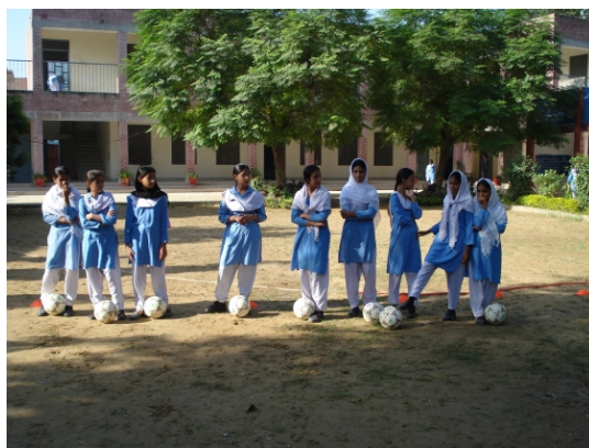
Female Coaches Training Session at Government Girls High School, Model Town, Sialkot.