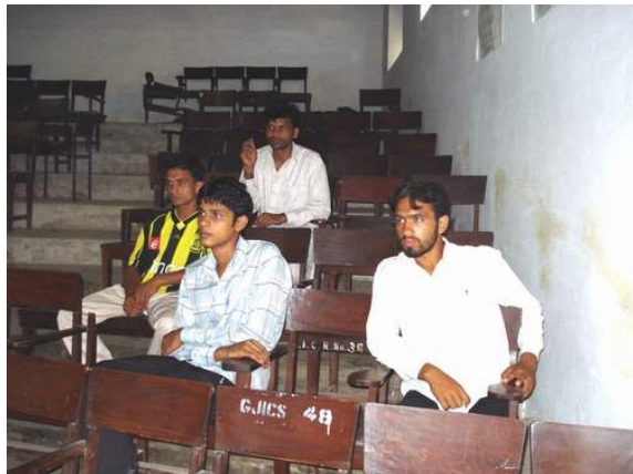
Referees and Administrators Training Session at Government Jinnah Islamia College, Sialkot.